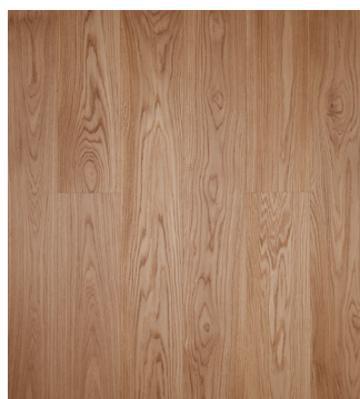
Eg Prime børstet Varenr.: 145058n DB nr.: 2119602