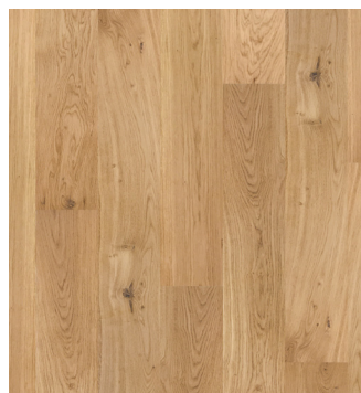
Eg Accent børstet Varenr.: 145023n DB nr.: 2119594