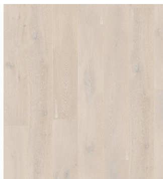
Eg Accent børstet Varenr.: 145022n DB nr.: 2119593