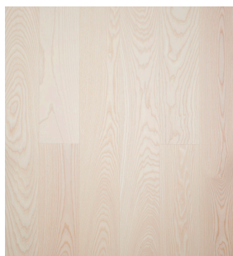
Ask Prime børstet Varenr.: 145029n DB nr.: 2119595