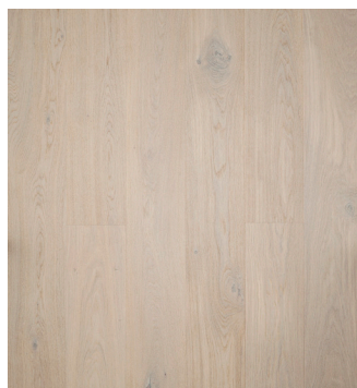
Eg Accent børstet Varenr.: 145052n DB nr.: 2119601