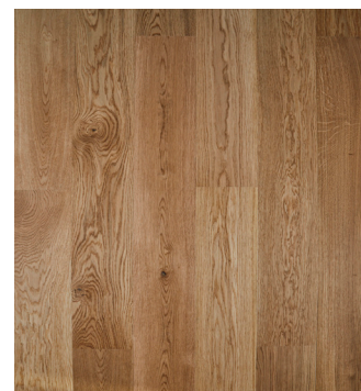
Eg Accent børstet Varenr.: 145033n DB nr.: 2119599