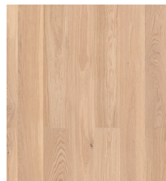
Eg Prime børstet Varenr.: 145070n DB nr.: 2119604