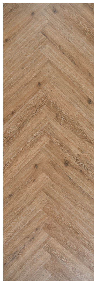
Sildeben Natural Oak Varenr.: 155014 DB nr.: 2085470