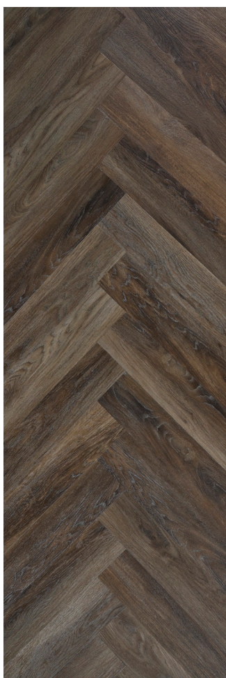
Sildeben Smoked Oak Varenr.: 155002 DB nr.: 2257896