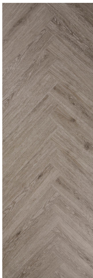
Sildeben Steel Oak Varenr.: 155009 DB nr.: 2133609