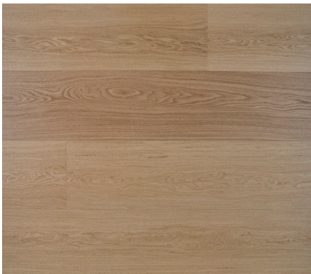
147060 Eg Prime natur 12x265x2420 mm

Timberman Innoplank • Til svømmende montage • Dim: 12x265x2420 mm