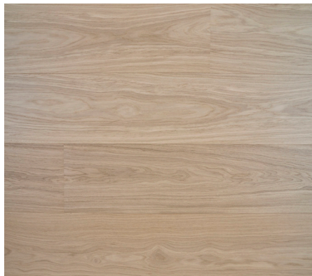
147070 Eg Prime hvid 12x265x2420mm