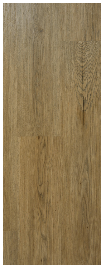
Linen Oak Varenr.: 80002832 DB nr.: 2279038