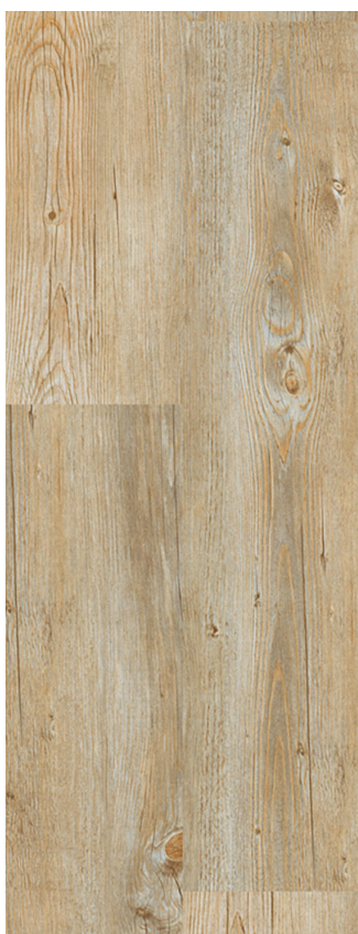
Alaska Oak Varenr.: 80002830 DB nr.: 2279032