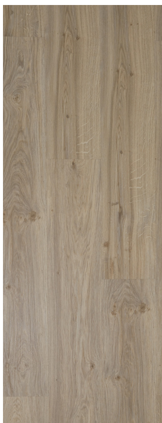
Pastel Oak Varenr.: 80002831 DB nr.: 2279037