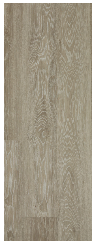
Washed Tundra Oak Varenr.: 80002833 DB nr.: 2279039